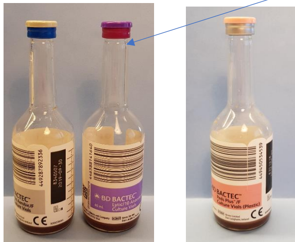
Aerob-, anaerob- samt PED-flaska i plast

Observera att det är en ny färgkod för den anaeroba flaskan .